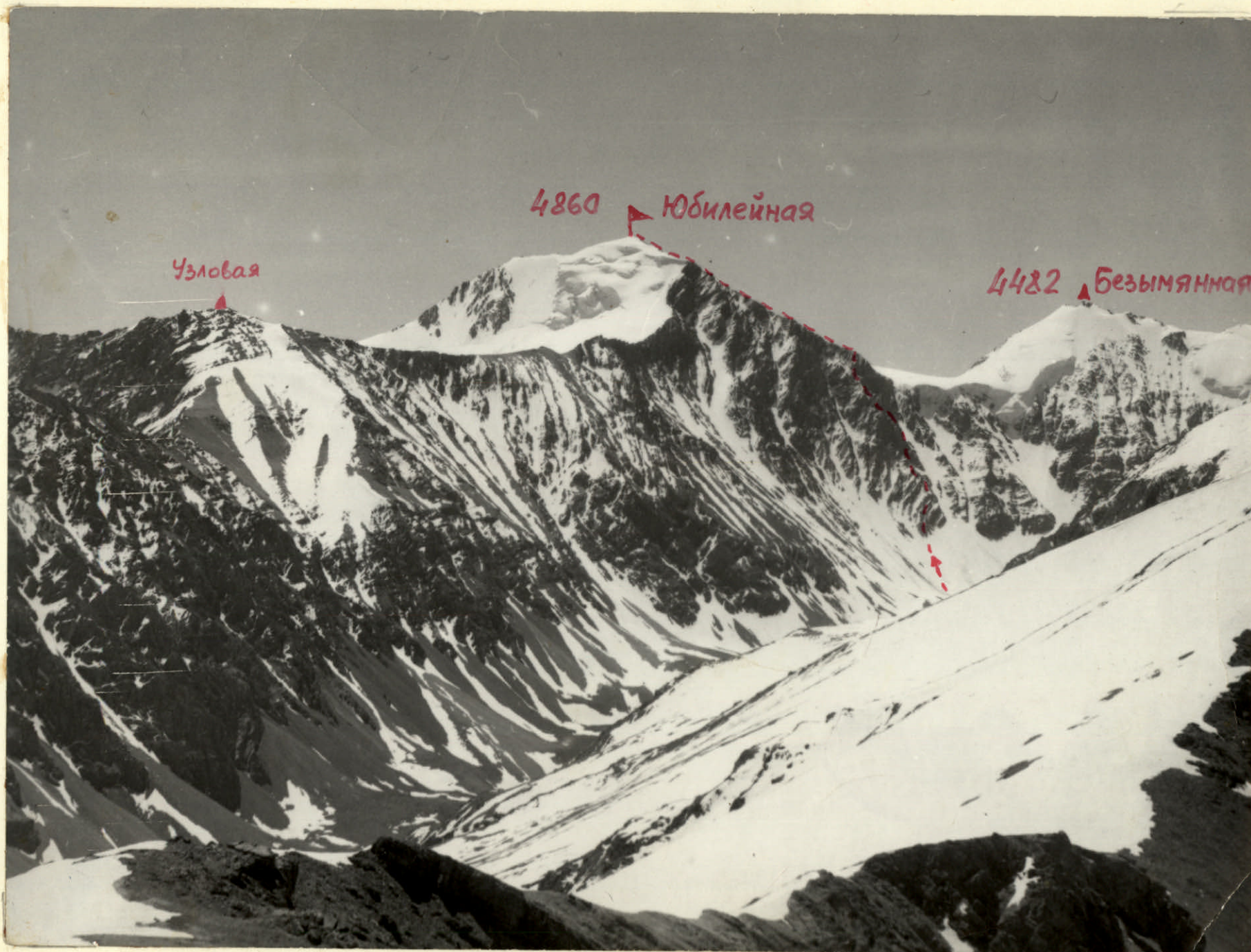
Общий вид вершины Юбилейная 4860 м.