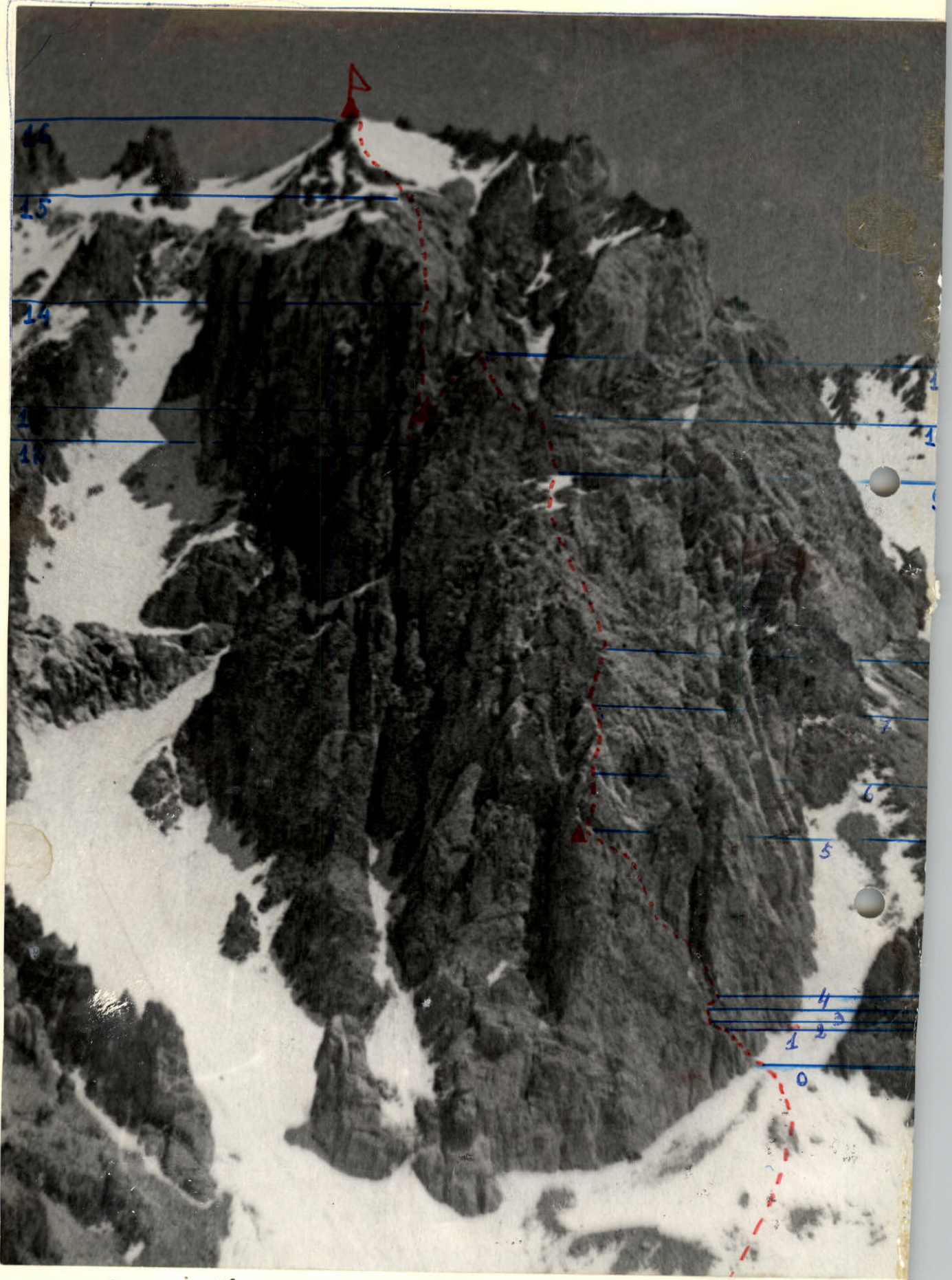
ОБЩИЙ ВИД В. В. СВЕРДЛОВСКОГО И ПУТЬ ВОСХОЖДЕНИЯ.