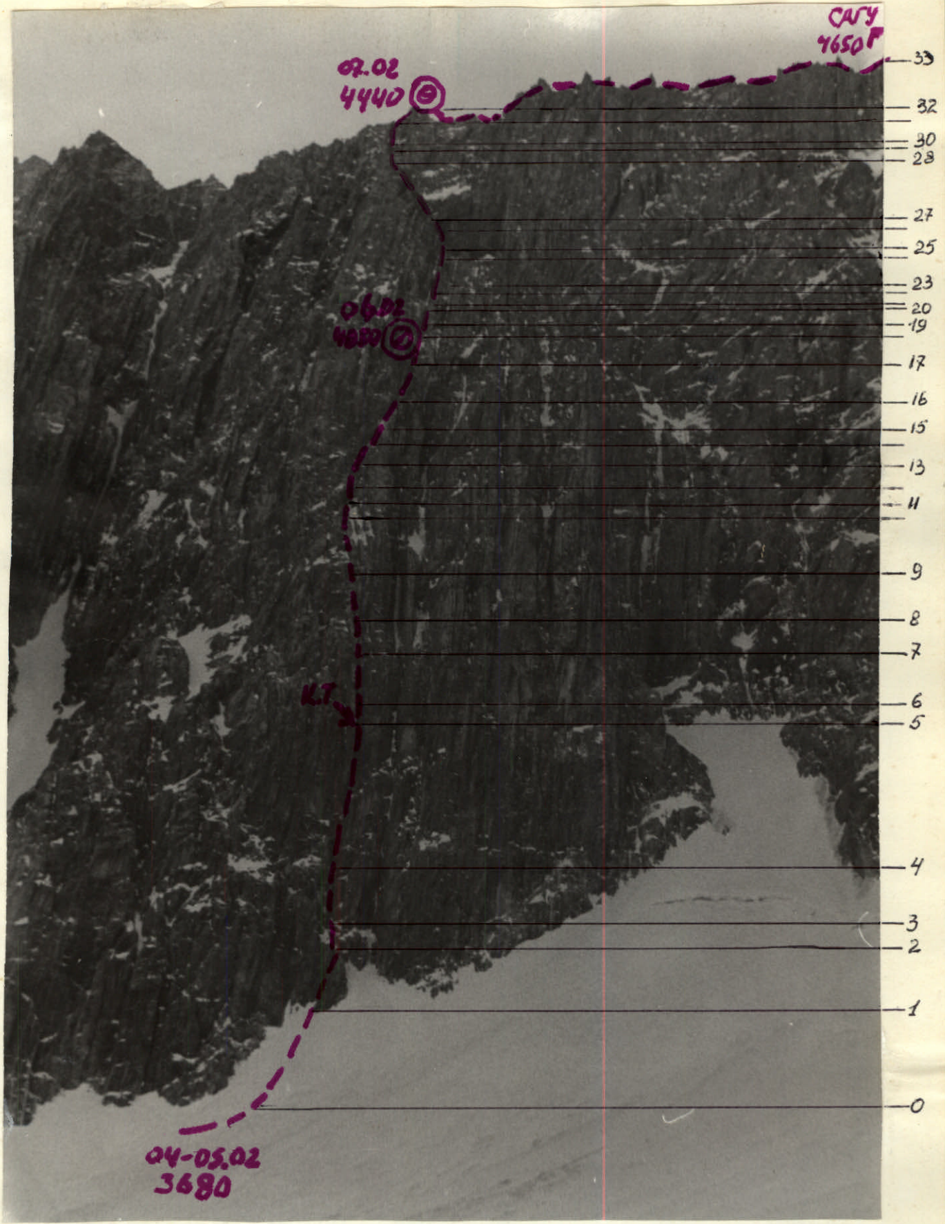
Общий вид маршрута первопрохождения на в.Сагу по левой части С.-З.стены и С.гребню