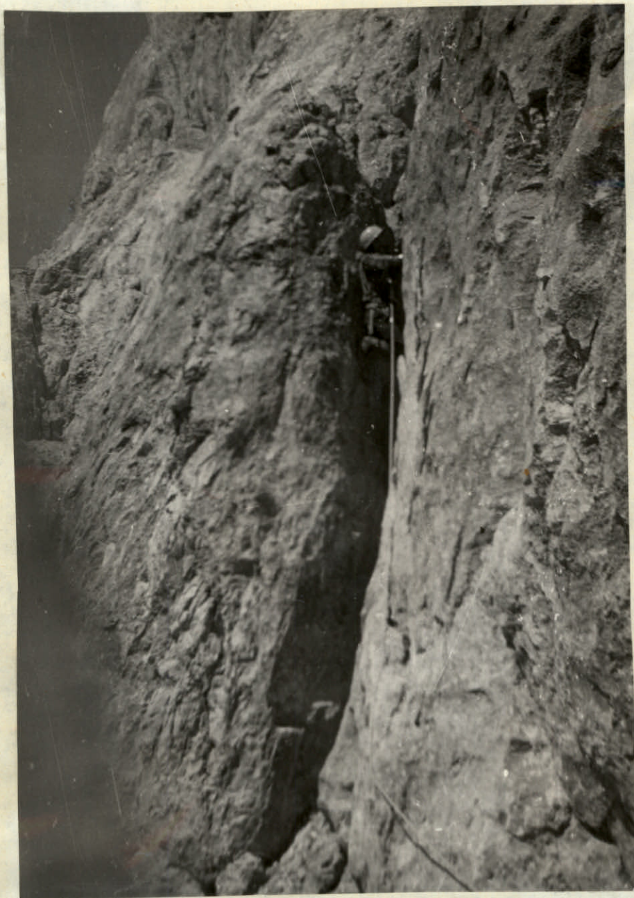
Ф. 5. Уг. 7. Камин.