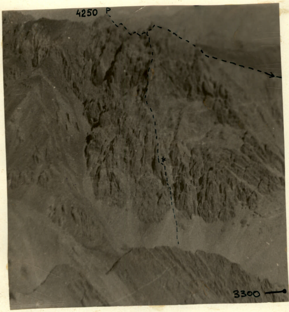
Облаки над стеной в. Калькуш с ребра САГУ. * - место фиксации.